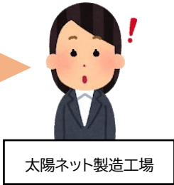
太陽ネット製造工場

防鳥網は網目がひし型(◇)です。 ひし形の網はたたむと網目が伸びて長くなります。 (例)巾 27mはたたむと約 36mほどの長さに伸びます。 納品時はたたまれ網目が伸びた状態で届くので、長さ方向を間違えて 張ってしまったお客様からお問い合わせをいただくことがあります。 長さ側に耳糸(張る時にロープを通す糸)がついておりますので 耳糸を確認してから作業をお願い致します。